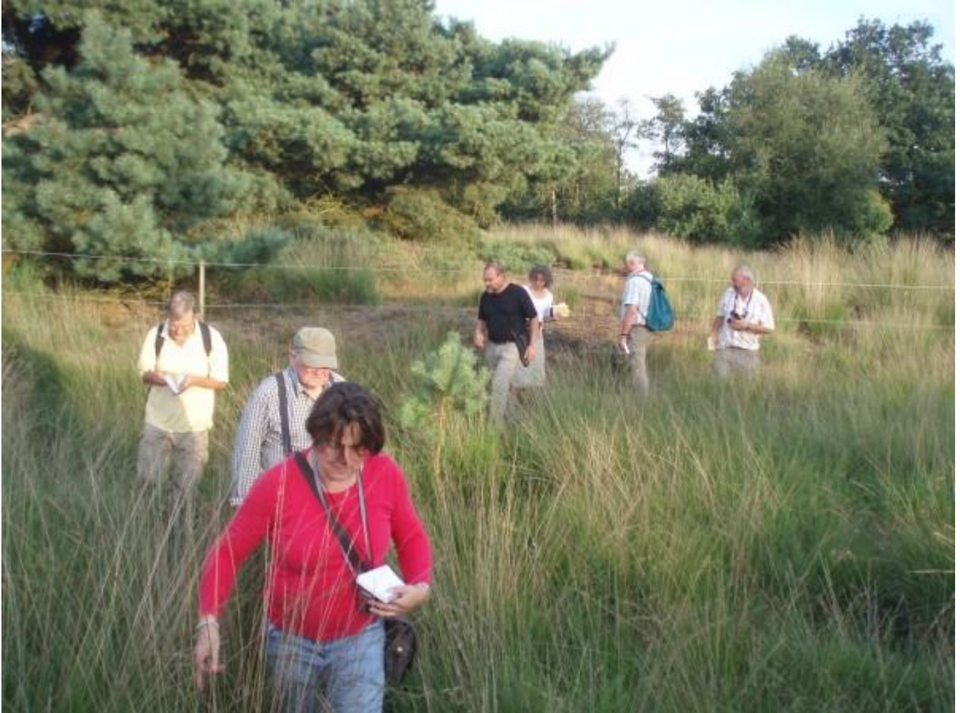
Deze foto dateert van augustus 2008.